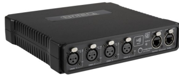
BT-NODE24 (3pin XLR)