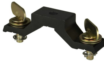
OMEGA BRACKET SMALL