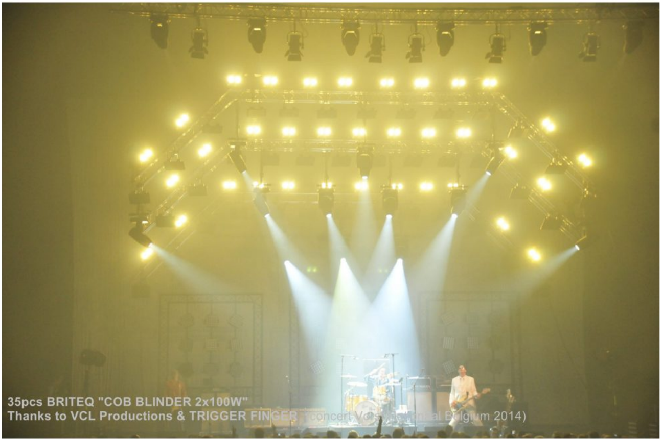
35pcs BRITEQ "COB BLINDER 2x100W" Thanks to VCL Productions & TRIGGER FINGER (concert Voorsymposium al Belgium 2014)