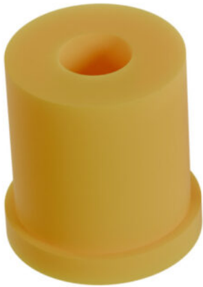
x 6 M25 4 - 8 mm