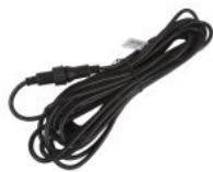
SIGNAL LINK CABLE 10M