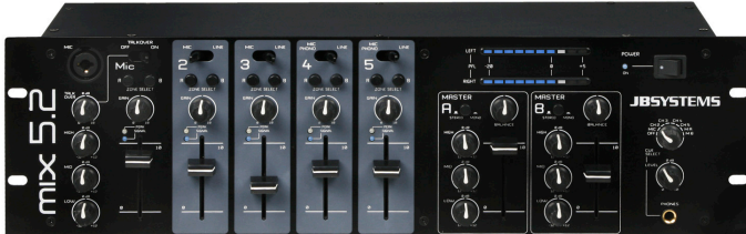
Table de mixage avec 5 canaux et 2 zones indépendantes.